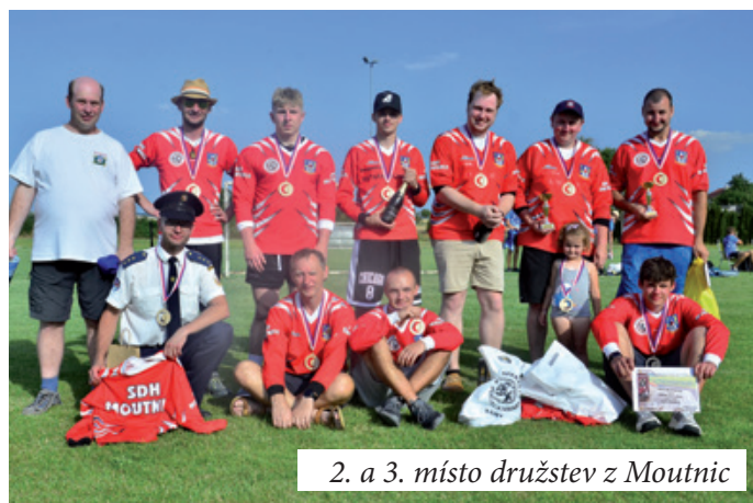
2. a 3. místo družstev z Moutnic