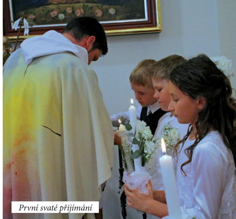
První svatě přijímání