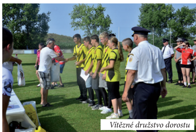
Vítězné družstvo dorostu