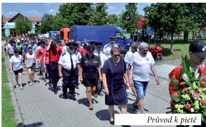
Průvod k pietě